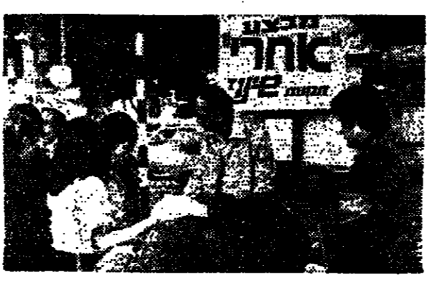
פיקוח תנועה עליו המהירים קוראים הרכבים ברחוב ירושלים. מבט מצילם במסגרת מבצע 'הארץ'

ליקויים בעלי משקל בתחומי הפיקוח על הבניה נתגלו בעיריית אשקלון. באת סופר, 'הארץ' ליקויים בעלי משקל בתחומי הפיקוח על הבניה נתגלו בעיריית אשקלון. באת סופר, 'הארץ' ליקויים בעלי משקל בתחומי הפיקוח על הבניה נתגלו בעיריית אשקלון.